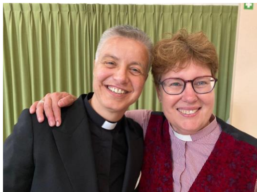
Nummer 11 en 5 😊

En toch is de beslissing om vrouwen toe te laten door onze synode