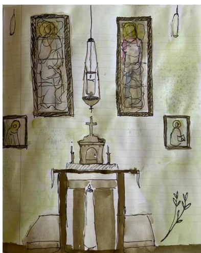
Tekening: Nell Hofman