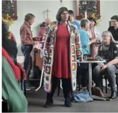
en zijn vrouw...