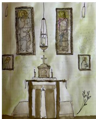
Tekening: Nell Hofman

Wie verhinderd is op één van de bovenstaande data, zorgt zelf voor een vervanger en geeft dit door aan de koster!